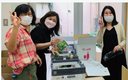
食品仕分けのために、たくさんのボランティアさんにご活躍いただいています。

株式会社マザーディクショナリー、児童養護施設「若草寮」・一般社団法人「Kid's Garden」・笹塚キリスト教会の皆さまのご協力をいただいています。