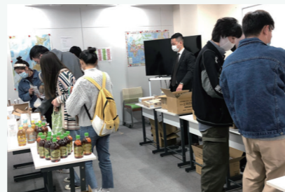
Food pantry bloom (外国人留学生対象のフードパントリー)

学校の休業で給食が無くなり、食費が家計を圧迫していたひとり親世帯からの支援の要請を受け、渋谷区生活福祉課が「低所得世帯への食料品の提供にかかる検討会議」を6回に渡り実施しました。