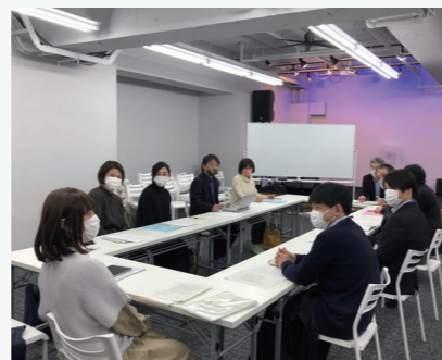
渋谷区生活福祉課が主催する検討会議に参加

学校の休業で給食が無くなり、食費が家計を圧迫していたひとり親世帯からの支援の要請を受け、渋谷区生活福祉課が「低所得世帯への食料品の提供にかかる検討会議」を6回に渡り実施しました。