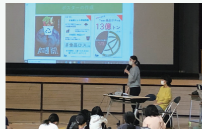
幡代小学校での様子

青山学院大学ボランティアセンターRoote食品ロスプログラムの協力を得て幡代小学校、千駄ヶ谷小学校にて5年生の総合学習の時間に「食品ロス」に関する出前授業を実施しました。質疑応答では、いくつもの手が挙がり、関心度合いの高さを感じられました。